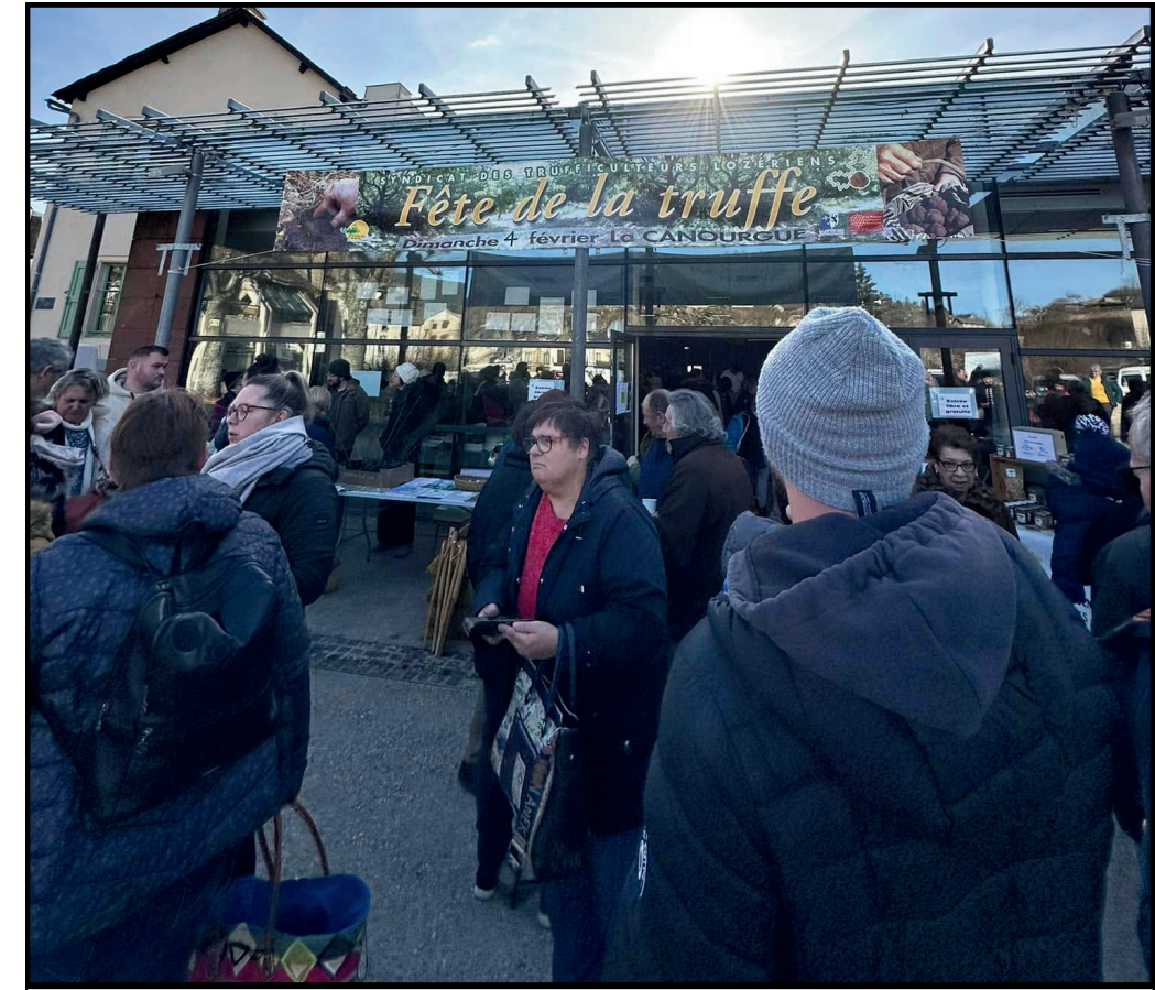
16 ÈME ÉDITION DE LA FÊTE DE LA TRUFFE LE 2 FÉVRIER À LA CANOURGUE