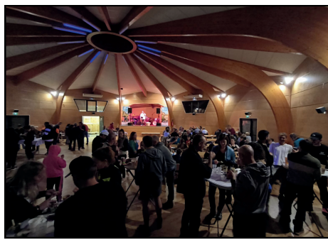
AU RECOUX LE 1ER FÉVRIER